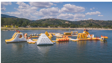
Jeux aquatiques gonflables