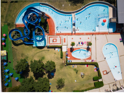
Piscine de Montrevel